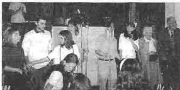
Transmitiendo la "llama" del Evangelio de generación a generación

El domingo 27 de octubre la Escuela Dominical celebró el Día de los Abuelos invitando a todos los abuelos a un acto muy especial. Por tal razón el Culto en Inglés se redujo a media hora para que los abuelos presentes pudieran concurrir al Salón donde las maestras y los chicos los agasajaron y también fueron invitados a tomar parte activa en los festejos.