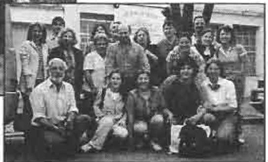
Delegación de la Iglesia de Temperley