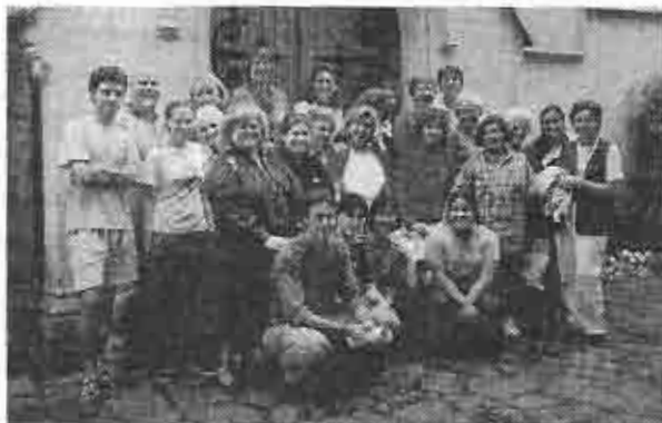
Mujeres (y un hombre) de la EPC con Acción Social

El miércoles 9 de octubre, el día de Acción Social, nos visitó el grupo de mujeres de la EPC de EE.UU. representado la organización "Women of Vision - W.O.V." (Mujeres de Visión). Luego se quedaron a almorzar para después salir directamente a la Provincia de Entre Ríos para participar en el anunciado "Encuentro de Mujeres de Entre Ríos". Durante el almuerzo se les pudo agradecer no solo su visita, que es tan alentadora, sino también especialmente agradecerles los envíos de ropa que hacen con tanta regularidad durante el año. Además, queremos agradecer la donación de varias Biblias en inglés que trajeron para el culto en ese idioma. ¡Su generosidad no tiene límites!